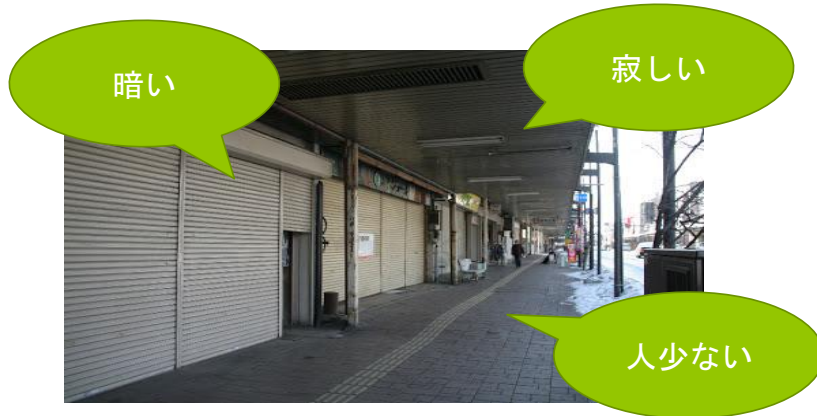
中心商店街空き地・空き店舗数の推移